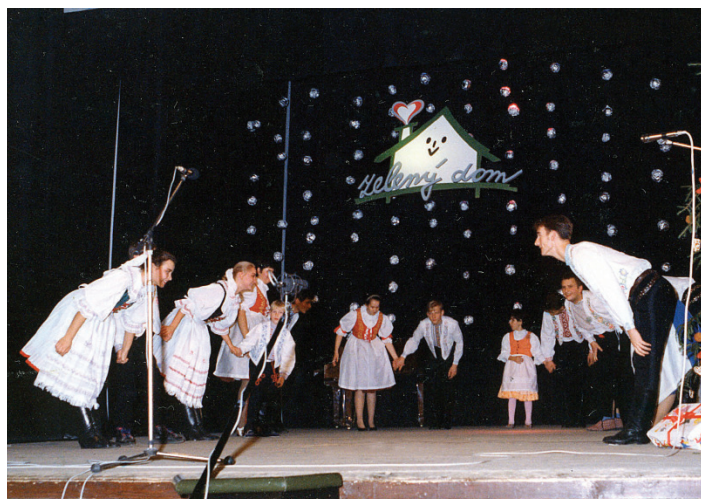
Vystúpenie s mentálne postihnutými deťmi, 1993.