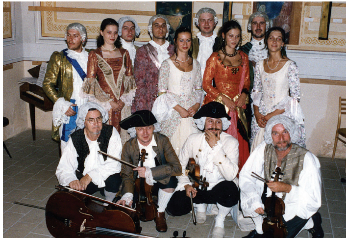
Súbor Reminiscencie, 2002.